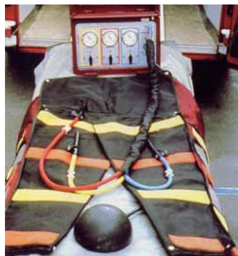
Pantalon anti-choc de la BSPP.