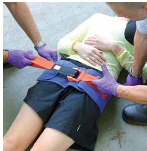
Contention sur ceinture pelvienne SAM Sling® (voir UP N°73).

Devant une instabilité hémodynamique et la suspicion d'une fracture du bassin, il peut être recouru