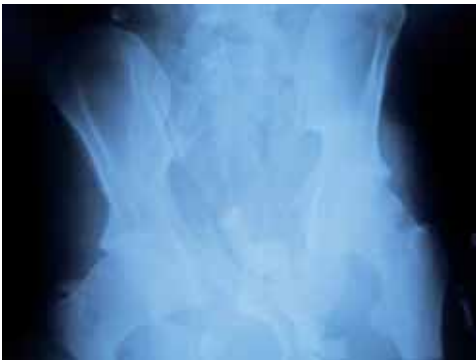
Annexe 1 : Radiographies de bassin avant et après contention par bandes élastiques chez un patient en choc hémorragique.

en urgence à l'utilisation du pantalon antichoc. Le pantalon antichoc présente un double intérêt hémodynamique et hémostatique. La mise en place d'un pantalon antichoc impose dans tous les cas une intubation trachéale et une ventilation mécanique. De principe, le pantalon antichoc est contre-indiqué chez le polytraumatisé suspect de lésions thoraciques graves. Il existe également un risque d'ischémie des membres inférieurs responsable dans certains cas de syndromes de loges. Ce risque impose une surveillance très attentive et l'utilisation de pressions de gonflage basses. La responsabilité largement prédominante des lésions artérielles dans le syndrome hémorragique justifie la place prépondérante de cette technique dans l'arsenal thérapeutique en urgence [4,6] . La contention par un drap ou une ceinture enroulant le bassin au niveau des grands trochanters et serré fortement est simple à réaliser, peu coûteuse et efficace dans un premier temps ( Annexe 1 ). Selon un premier bilan clinique et notamment la présence d'un syndrome hémorragique, il est alors fondamental de diriger ces patients vers des cen-