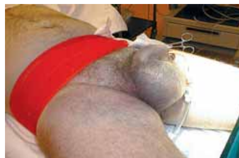
Ceinture pelvienne. Service des Urgences Genève.