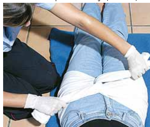
Placer le drap non roulé sous le bassin, au niveau des grands trochanters. S'assurer avant de serrer qu'aucun objet ne se trouve dans les poches. Serrer autour du bassin en respectant les rapports anatomiques. Bloquer le serrage par un noeud ou des pinces.